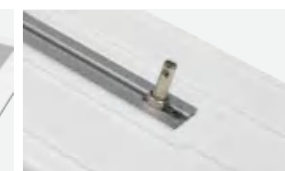
● 无需工具快速安装 吊杆间距可调设计